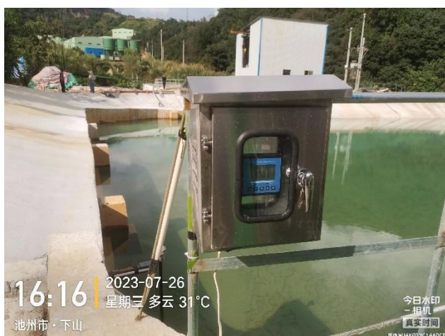
3#沉淀池 PH 自动监测设施