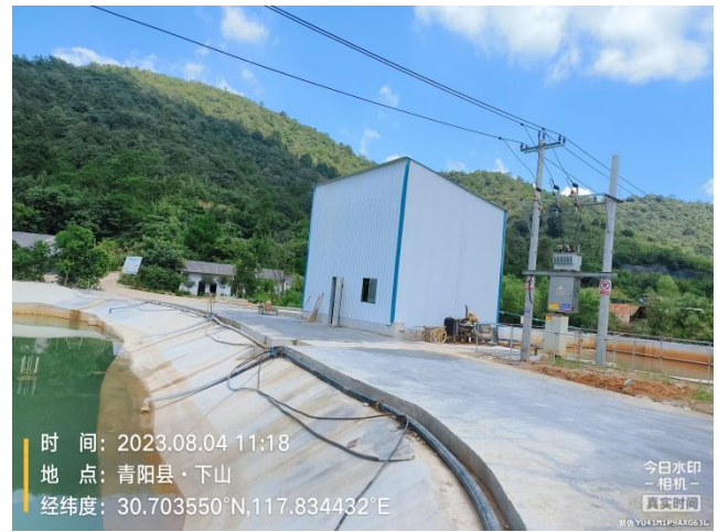
加碱设备厂房封闭