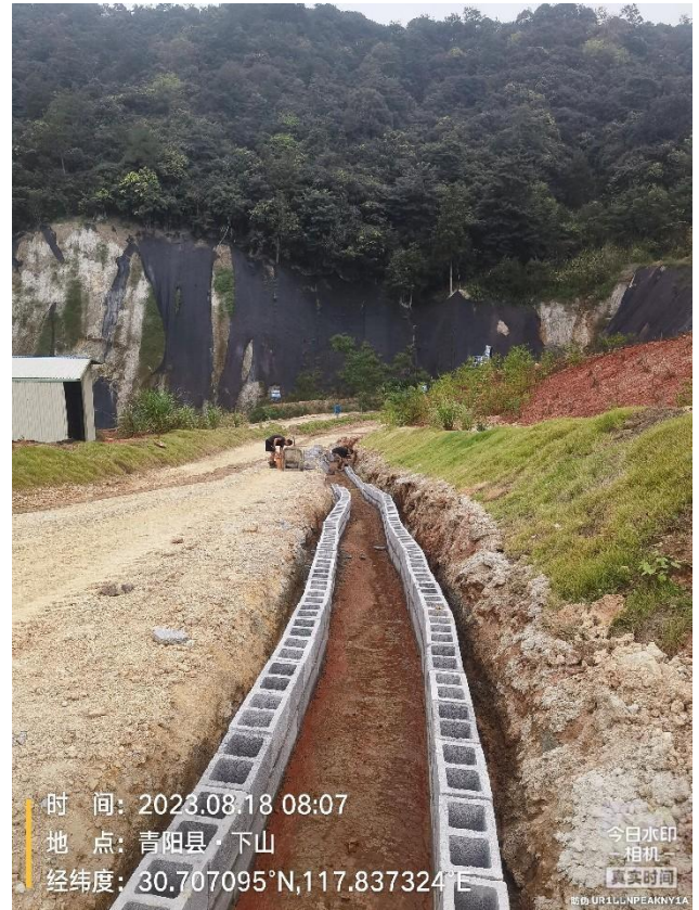
临时堆放场地水沟硬化过程