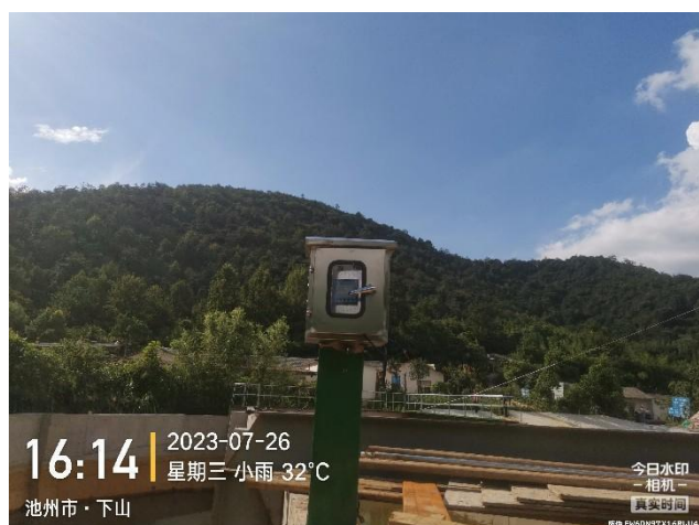
4#清水回用池 PH 自动监测设施