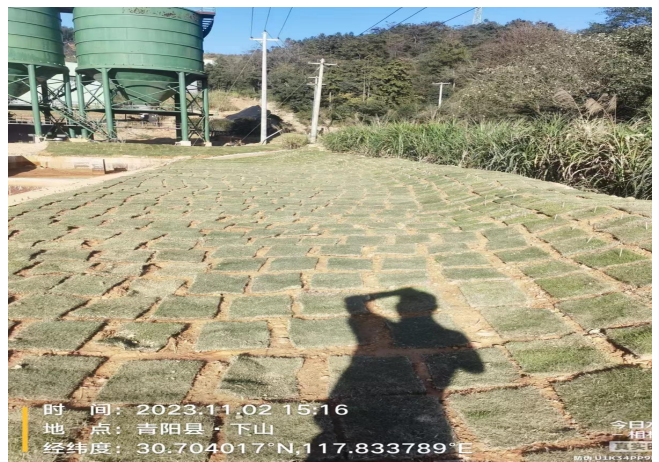
裸露地面已植被复绿