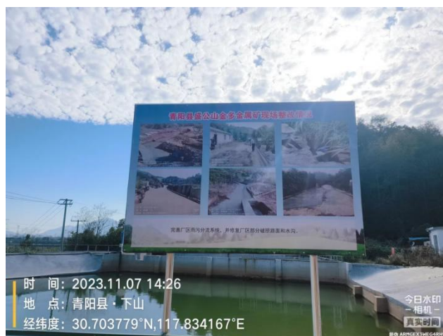
2#沉淀池树立整改情况标牌