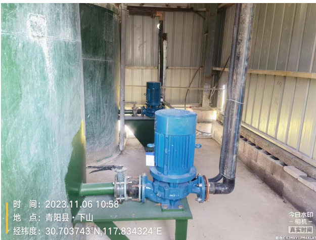
自动加碱设施完善