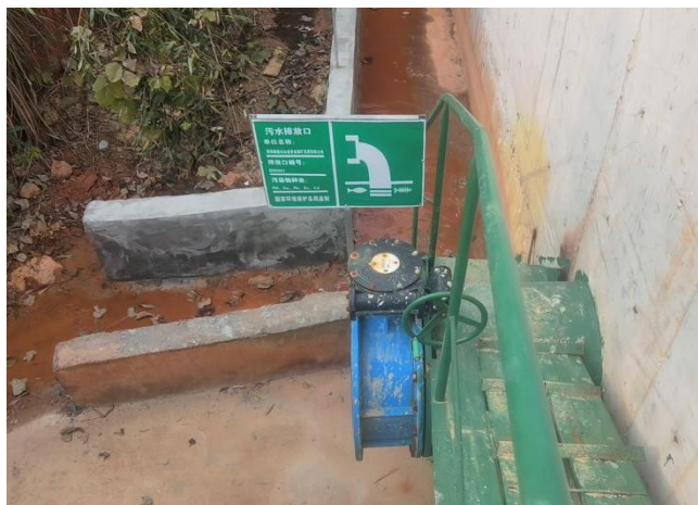
4#清水回用池污水排放口标识