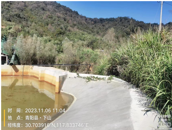
淋溶水已收集进入 1#沉淀池