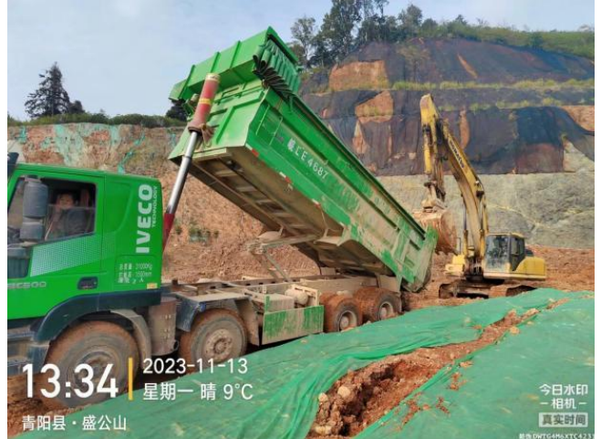
山塘底泥运至矿区回填