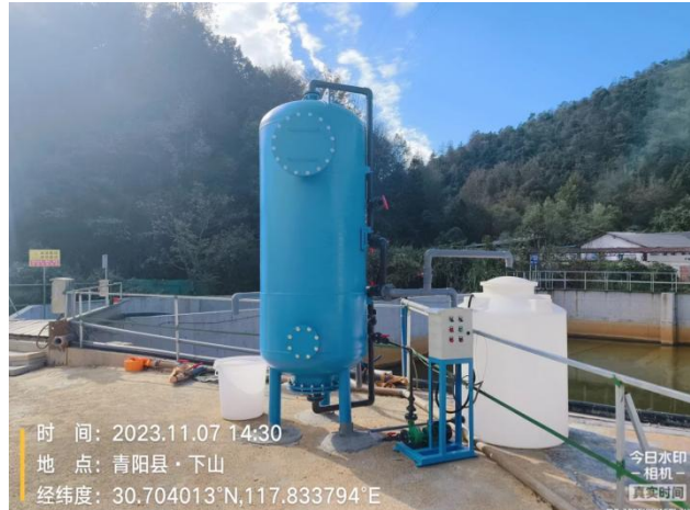
离子交换器已完成安装